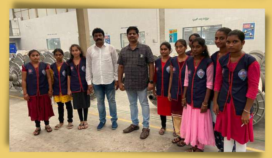
AT KALLAM TEXTILES PVT LTD, KUNKUPADU ON 11/10/2022