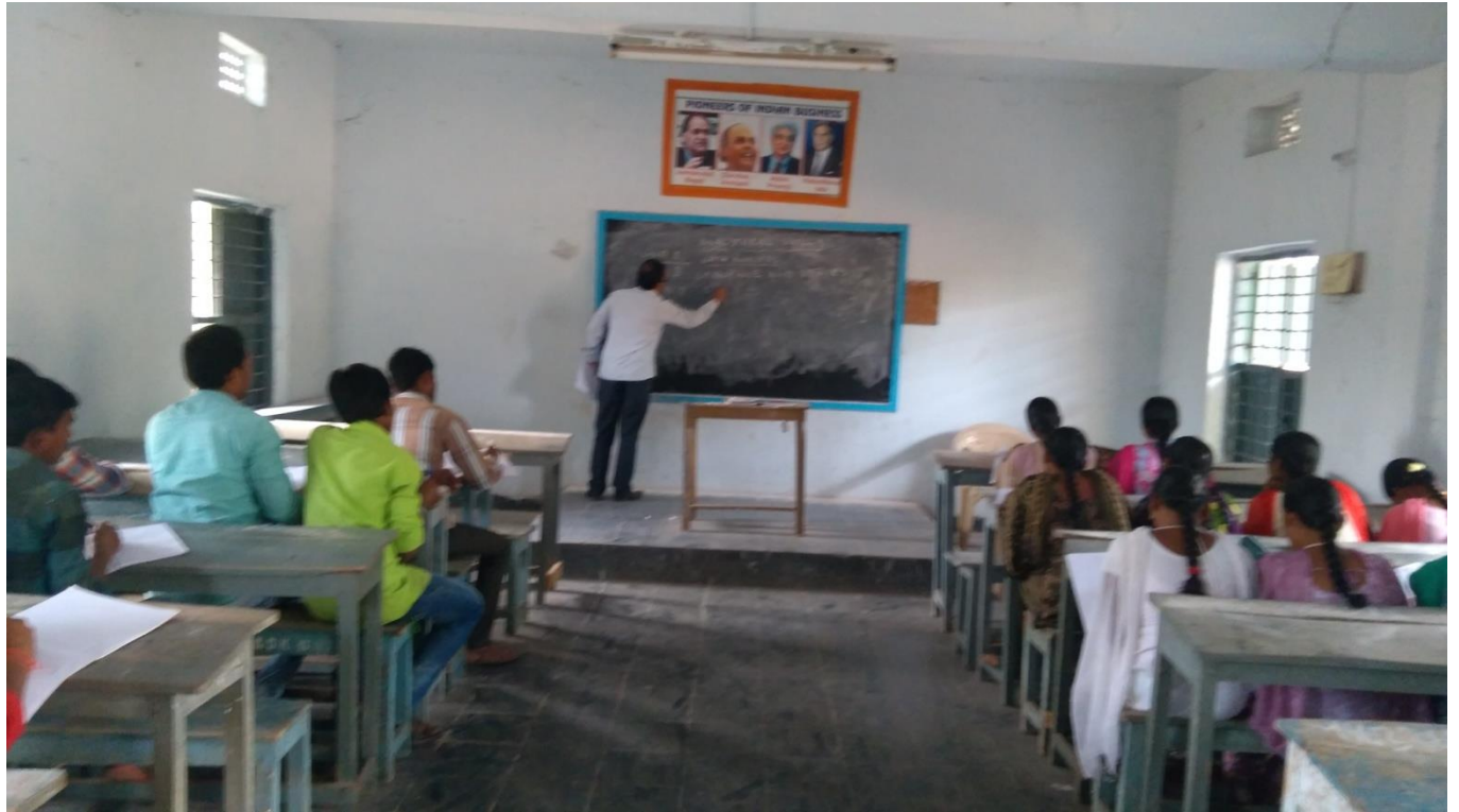
JKC Lab work for Batch II Students on 05.08.2017