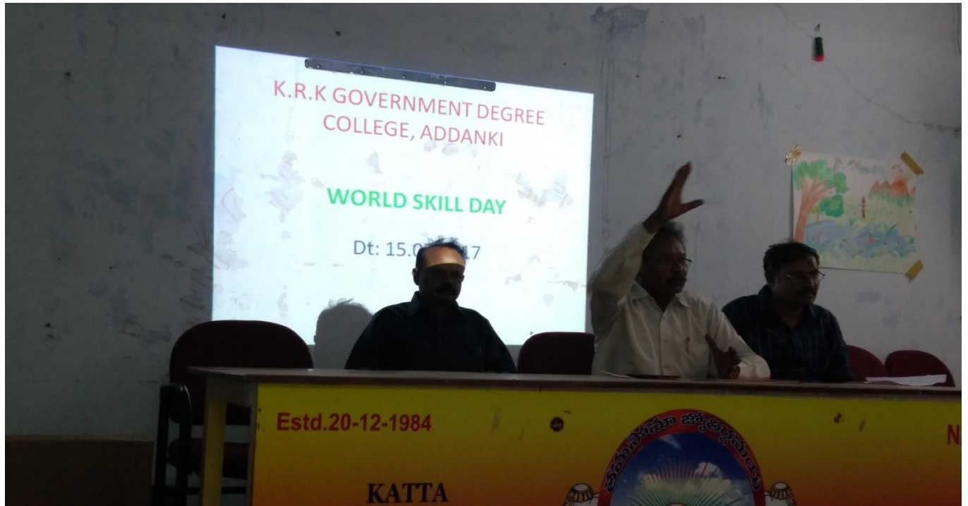
Staff & Students are attended World Skill Day Programme